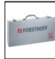
Item No. 7012 Metal case