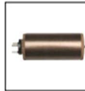
Item No. 3064 Heating element 3000 W, 230 V