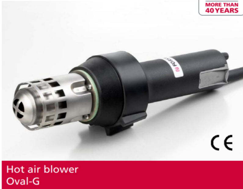
Hot air blower Oval-G

QUALITY MADE IN GERMANY FORSTHOFF MORE THAN 40 YEARS