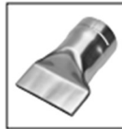
Item No. 4031 Wide slot nozzle 70 x 4 mm