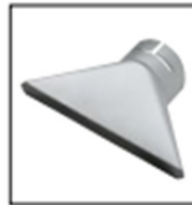
Item No. 4022 Wide slot nozzle 150 x 10