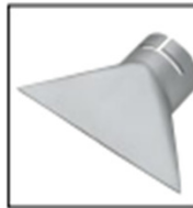
Item No. 4021 Wide slot nozzle 150 x 1